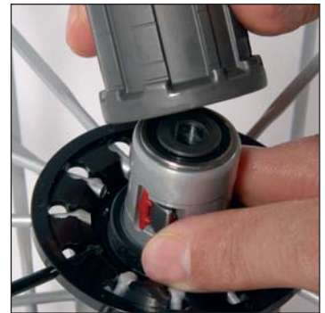
Reinserite la rondella distanziale sul cuscinetto del corpo del mozzo, abbassate i cricchetti e rimettete in posizione il corpo della ruota libera sul mozzo.

Rimontate l'asse seguendo la procedura appropriata ad ogni mozzo.