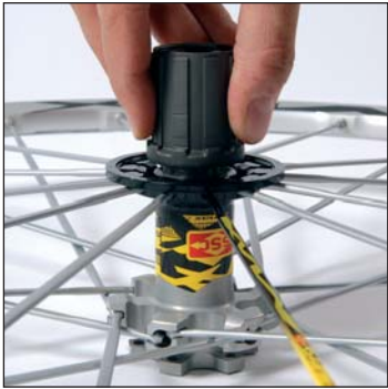
Rimuovere il corpo della ruota libera facendolo ruotare in senso antiorario.

Rimuovere l'asse seguendo la procedura appropriata ad ogni mozzo.