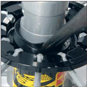
Riposizionate la guarnizione a labbro in battuta sul corpo del mozzo spingendola tra la base e il labbro utilizzando un utensile appuntito ma non tagliente.

Pulire meticolosamente il corpo del mozzo, i cricchetti, il corpo della ruota libera, la rondella distanziale e la guarnizione a labbro.