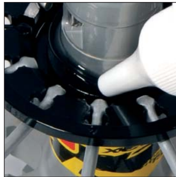
Lubrificare l'interno del corpo della ruota libera nella zona dentata in maniera tale da riempire da 2 a 3 scanalature del corpo della ruota libera. Depositare pure un goccia d'olio minerale Mavic M40122 sulla guarnizione a labbro.