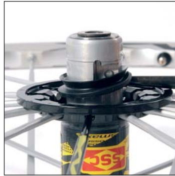
Rimuovere delicatamente la guarnizione a labbro utilizzando un utensile appuntito ma non tagliente.

Pulire meticolosamente il corpo del mozzo, i cricchetti, il corpo della ruota libera, la rondella distanziale e la guarnizione a labbro.